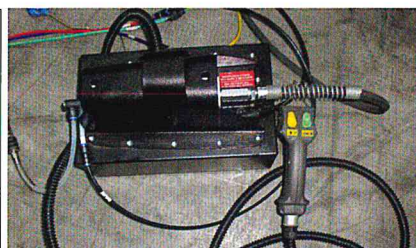
Pompa d'aria idropneumatica Standar hydro-pneumatic air pump