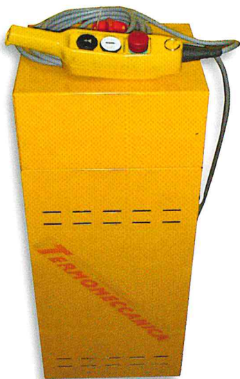
Centralina elettroidraulica / Control box